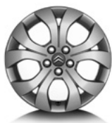
16" lichtmetale 215/60 R16